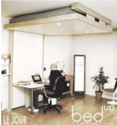
Un lit à hisser au plafond durant la journée...