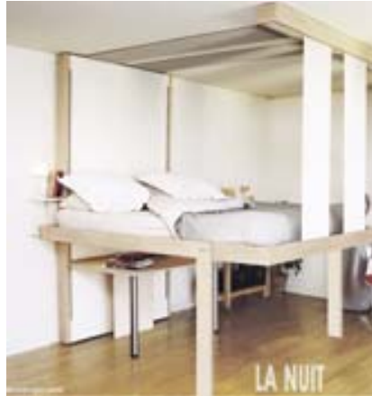
... et à descendre pour la nuit (Bedup).

Agencements intérieurs, espaces modulables, meubles escamotables : plus que jamais, architectes et designers cherchent des solutions pour les petites surfaces.